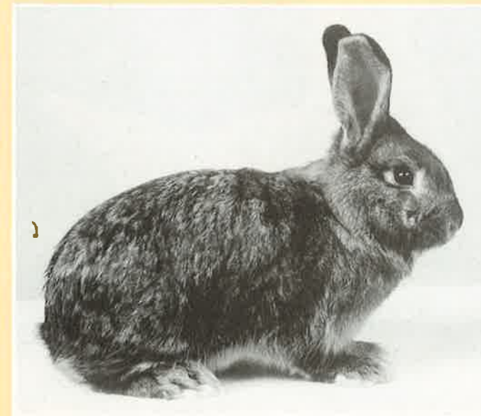
Deilenaar ram jong.