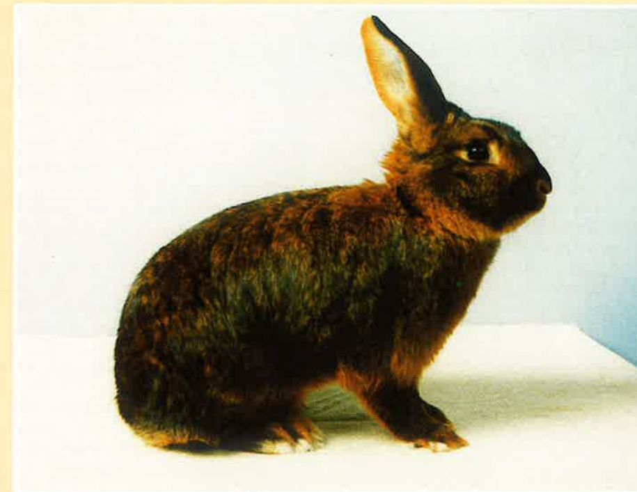
Deilenaar ram jong.

wieg van de Deilenaar heeft gestaan, kon het op zijn manier prachtig vertellen hoe het moest zijn. Bloemrijke taal was één van zijn sterke punten, en hier drukte hij zich dan ook meestal in uit. Hij onderscheidde het verschil in ticking en rupstekening duidelijk door de ticking als z.g. dubbeltjeswerk te zien (golvend en onregelmatig) en de rupstekening als streepjeswerk (regelmatig). Om deze ticking nu goed te laten uitkomen moet de beharing vooral niet te kort zijn, maar langer dan normaal haar. Deze ticking moet ook duidelijk aanwezig zijn op de borst en de benen, maar is hier regelmatiger door de daar aanwezige kortere beharing. De snuit, de kaakranden en de binnenzijde van de oren zijn tankleurig. De oorranden zijn diepzwart omzoomd. De buik is roomkleurig, en een lichte tankleur wordt toegestaan. De afscheiding tussen buik en flanken wordt gevormd door een smalle roestrode streep. Er moet voldoende contrast zijn tussen deze streep en de flankkleur. De grondkleur aan de buik is wit, onder de navel en in de schootvlekken is